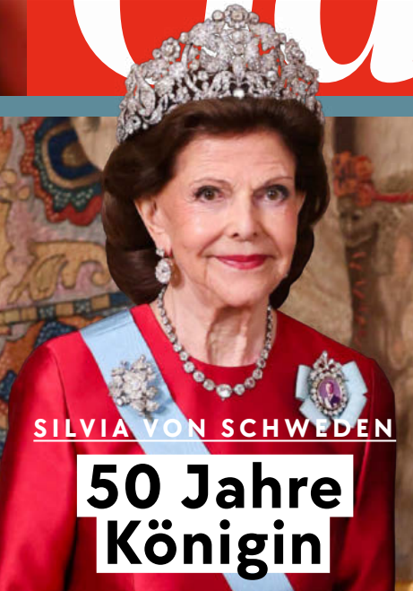
SILVIA VON SCHWEDEN